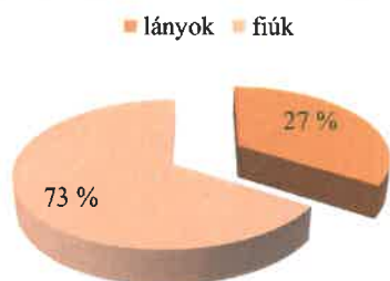
Nappali tagozatos tanulók megoszlása

Az intézmény nappali tagozatos, diákjait 99%-ban a megye adja. 1 tanuló magyar anyanyelvű, kettős állampolgár /ukrán-magyar/, 1 tanuló ukrán állampolgár. Ők üde „színfoltjai” az iskolának. Műszaki középiskola ellenére meglepően sok a lány.